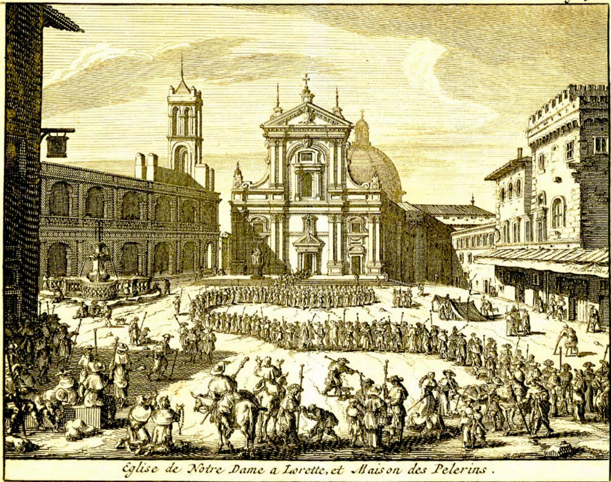
Eglise de Notre Dame a Lorette, et Maison des Pelerins .