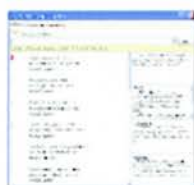
Fig. 4. Scheda ritmica con i dati di ricerca