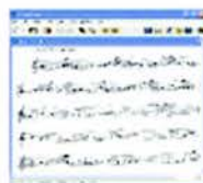
Fig. 3. Trascrizione ritmica della musica

Le immagini sono visualizzate attraverso il programma Adobe Acrobat , mentre i film sonori sono registrati nei formati formati MP3 o WAV.