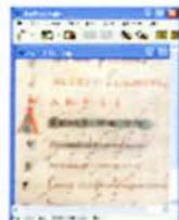
Fig. 1. Riepilogo dei manoscritti

Il Corpus consiste nell'edizione testuale e musicale delle poesie liriche latine dalle origini all'età carolingia: prima edizione critica, nata in formato digitale di tali materiali e una delle prime in assoluto nel campo latino medioevale.