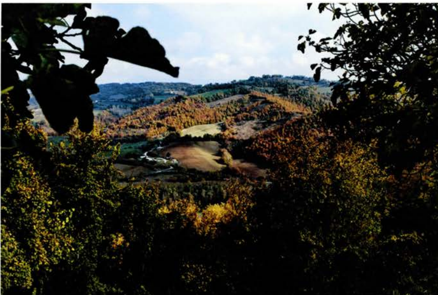
Associazione Terra Mater Gubbio &gt; sentiero francescano assisi-gubbio