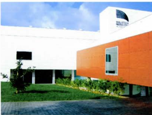
Pontos fortes da cidade de Vila Real - nervas_vr