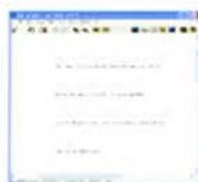
Fig. 2. Trascrizione vocale digitalizzata